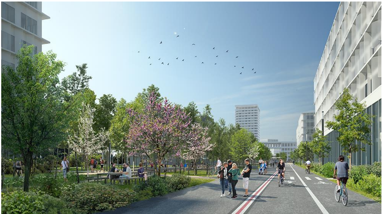
© La Graine Studio - OLM

D'ici à 2026, pour offrir un nouveau lieu de vie entre la place Marcel Bouilloux-Lafont au nord et le Campus d'Innovation au sud, 1 km de piste non-inscrites à l'inventaire des Monuments historiques sera métamorphosé en un grand parc linéaire généreusement planté de plus de 1 600 arbres et agrémenté de nombreux espaces dédiés aux loisirs et à la promenade.