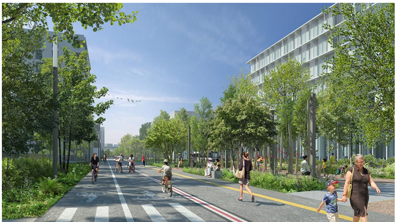
La Graine Studio - OLM