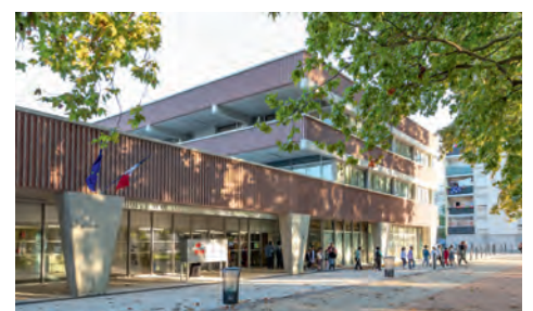
Le nouveau groupe scolaire Marie Marvingt, regroupant maternelle et élémentaire dans un même lieu.