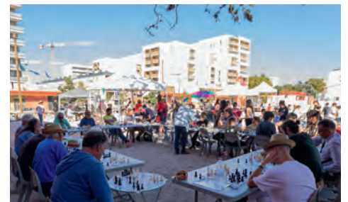
La Mairie de Toulouse, le centre culturel La Brique Rouge et les associations locales animent le quartier tout au long de l'année.

• Déplacez-vous facilement et rapidement grâce à une offre de transports en commun complète (train, métro, bus, vélo) et un accès direct au périphérique.