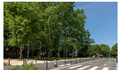
La nouvelle rue de Toulon ouvre le quartier vers la Garonne.