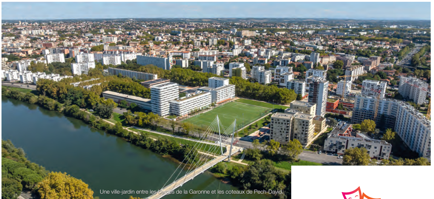
Une ville-jardin entre les berges de la Garonne et les coteaux de Pech-David.