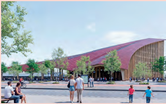
La future Halle des mobilités, destinée à faciliter l'accès à la gare, aux lignes A et C du métro et à une vélostation de 1 000 places.