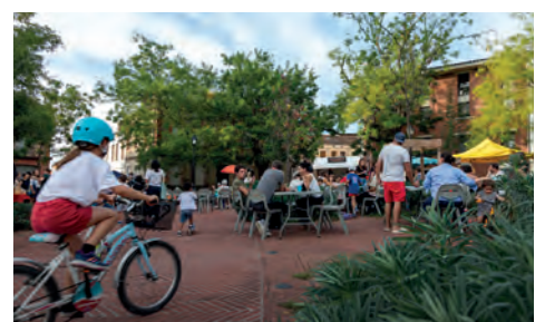
Fête de quartier sur la place Arago, réaménagée et végétalisée en 2020.