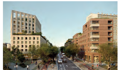
Projection de l'avenue Olivier Guichard (ex av. de Lyon) vue depuis le pont ferroviaire et le faubourg Bonnefoy.

Un pôle d'échanges d'envergure prêt à accueillir 150 000 voyageurs/jour à horizon fin 2028