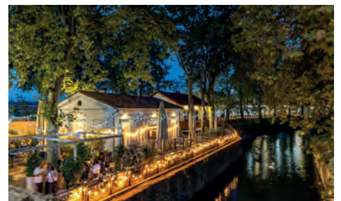
La maison écluisière transformée en guinguette, avec vue sur le canal du Midi.