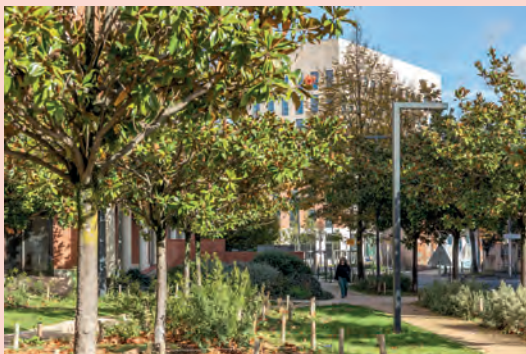
La placette aux magnolias, végétalisée en 2024.

➤ Le quartier se végétalise, pour s'adapter au changement climatique : voiries et places arborées, création de 4 hectares d'espaces verts dont le parc du Raisin, valorisation du canal du Midi et de ses berges... 70 arbres ont déjà été plantés sur le nouveau parvis de la gare Matabiau, et à terme, plus de 700 arbres agrémenteront le quartier.