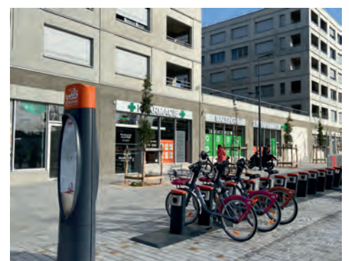
La place Nina Simone, nouvelle centralité du quartier.