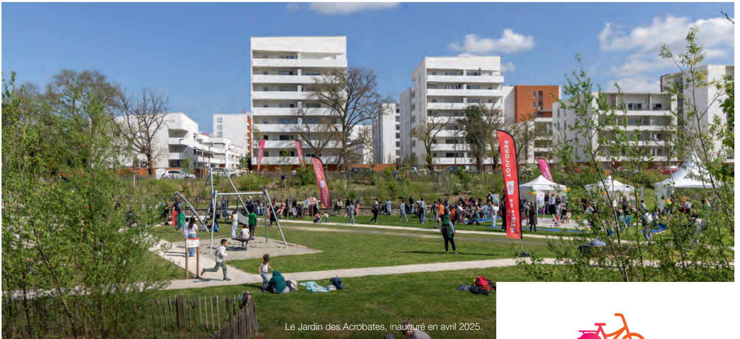
Le Jardin des Acrobates, inauguré en avril 2025.