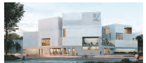
Le futur complexe socio-culturel et sportif, qui ouvrira fin 2028.

• Bénéficiez d'une offre sportive, socio-culturelle riche et diversifiée grâce au futur équipement public qui s'implantera au cœur du quartier fin 2028 : gymnase, dojo, mairie de quartier, médiathèque, centre culturel, ludothèque, salle de spectacle de 200 places, restaurant, espace seniors et club ados.