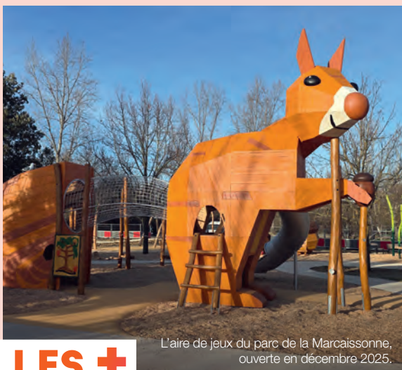
L'aire de jeux du parc de la Marcaissonne, ouverte en décembre 2025.