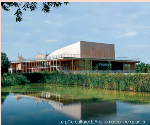
Le pôle culturel L'Aria, en cœur de quartier, accueille une salle de spectacle, une médiathèque et un auditorium.