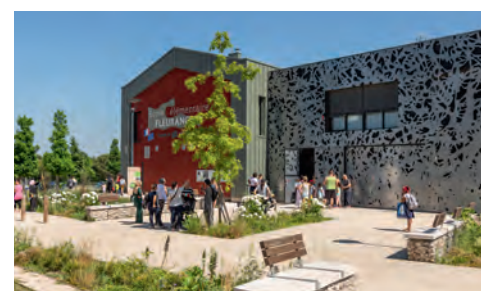
L'école élémentaire Fleurance au pied de chez vous