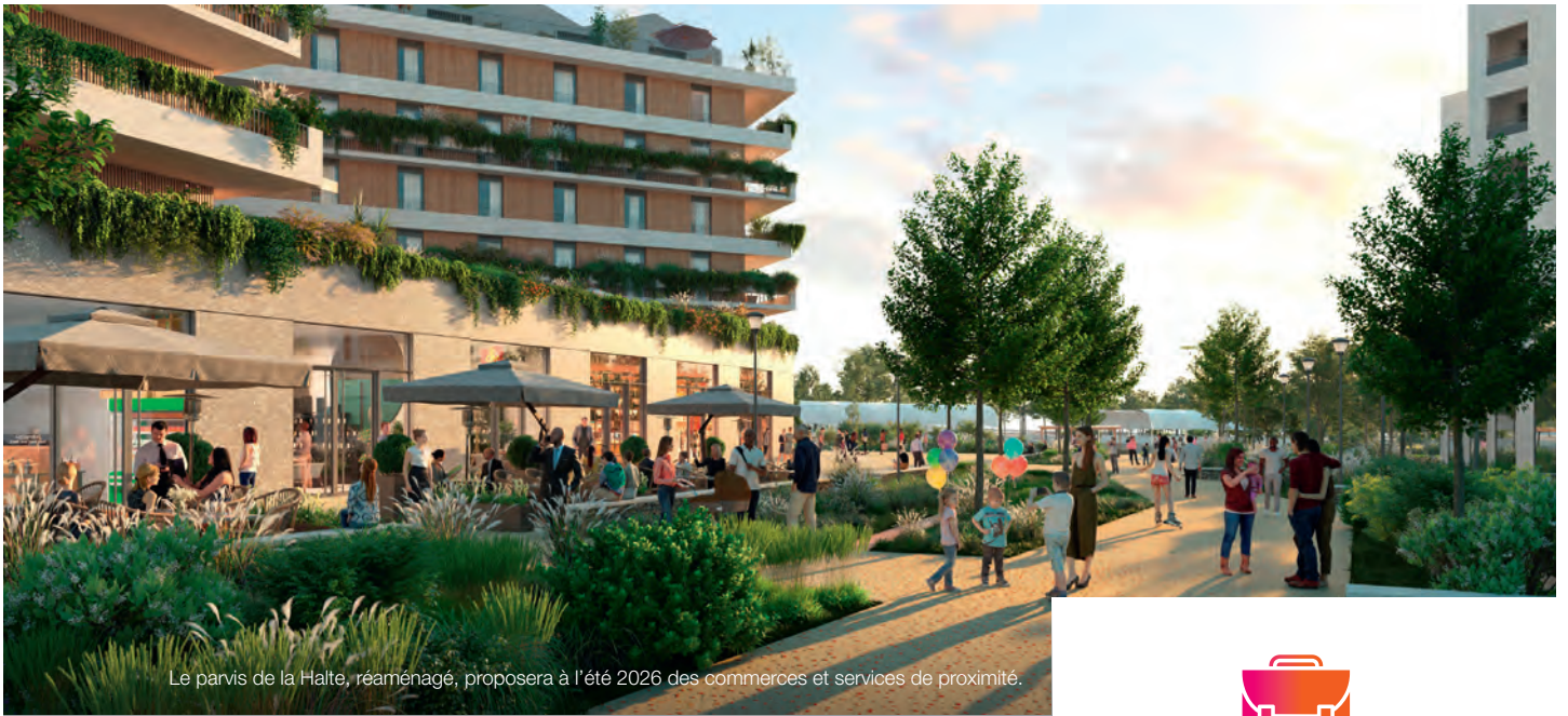
Le parvis de la Halte, réaménagé, proposera à l'été 2026 des commerces et services de proximité.