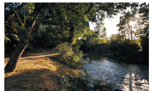
Le cadre bucolique de la coulée verte des berges du Touch

• Devenez acteur de la construction du quartier, en participant aux ateliers de concertation ou aux balades urbaines. Participez aux nombreuses animations et événements portés par les associations du quartier.