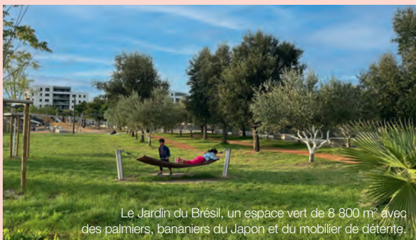
Le Jardin du Brésil, un espace vert de 8 800 m 2 avec des palmiers, bananiers du Japon et du mobilier de détente.

Un nouveau parc linéaire de 1,2 km, planté de plus de 1 600 arbres prend place sur l'ancienne piste de l'aéropostale. Il propose des aires de jeux pour enfants, des agrès sportifs, des parcours de glisse, des terrains de pétanque ou Mōlky, des tables de ping-pong et de jeu d'échecs, un babyfoot, un pumphack, des aires de pique et du mobilier de détente.