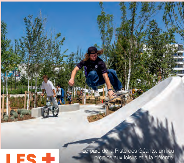
Le parc de la Piste des Géants, un lieu propice aux loisirs et à la détente.