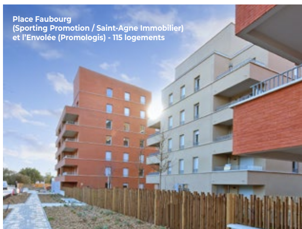
Place Faubourg (Sporting Promotion / Saint-Agne Immobilier) et l'Envolée (Promologis) - 115 logements

Prenant place au cœur du quartier, entre la route de Revel et la place Nina Simone, six nouvelles résidences viennent d'être livrées. Bienvenue aux nouveaux arrivants !