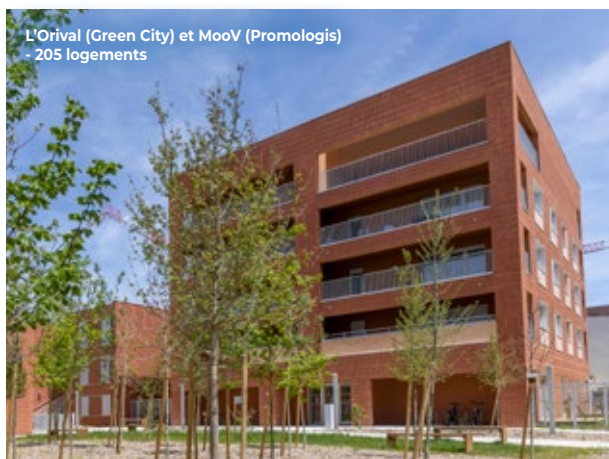
L'Orival (Green City) et MooV (Promologis) - 205 logements