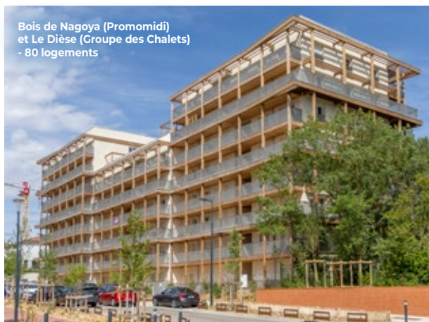
Bois de Nagoya (Promomidi) et Le Dièse (Groupe des Chalets) - 80 logements